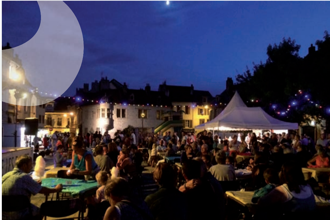
Soirée Cabaret organisée par le Comité des Fêtes dans le cadre des Baume d'été