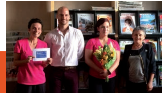
Le Grand Défi de France Bleu Besançon à Baume les Dames