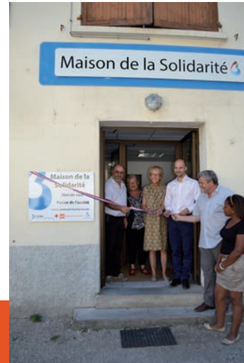
Inauguration de la Maison de la Solidarité, accueillant notamment l'Épicerie solidaire