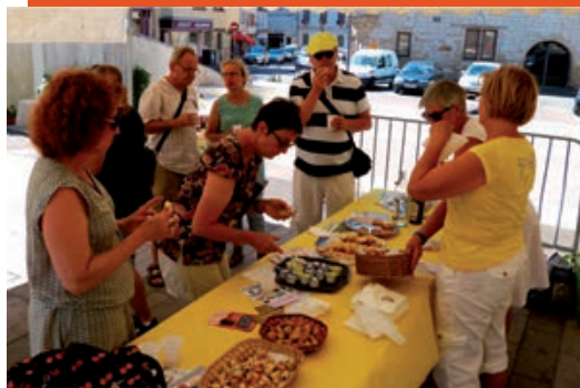
Mardis d'accueil organisés tout l'été par l'Office du Tourisme