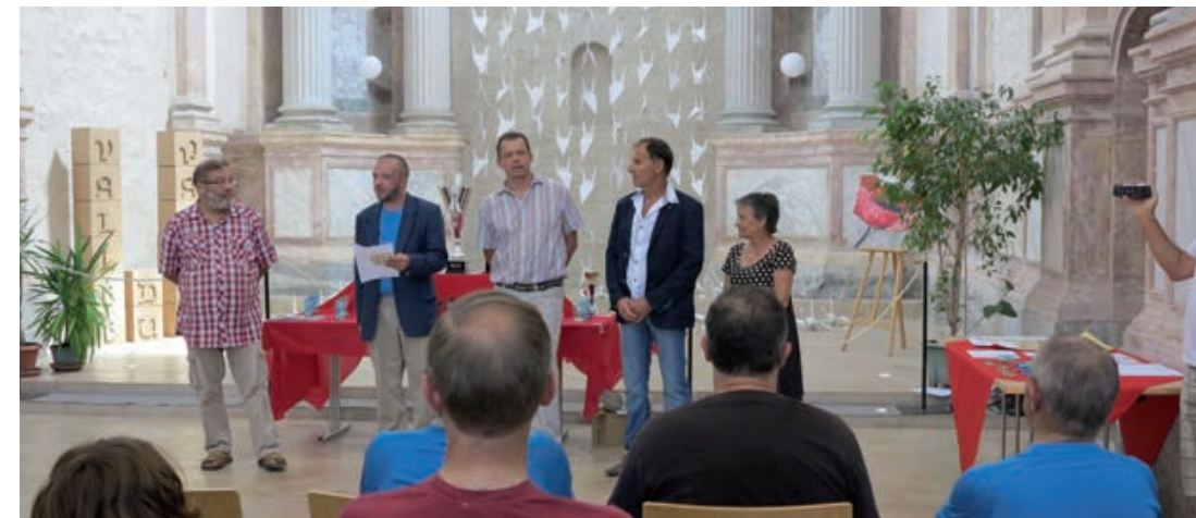
Remise des prix lors de la 5 ème étape de la Coupe du Monde du jeu de dames