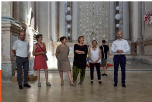
Vernissage à l'Abbaye de l'exposition estivale sur le Papier