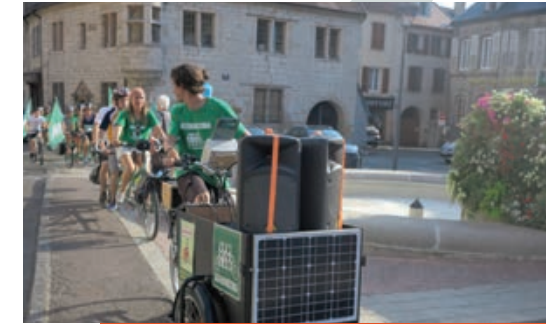
Accueil du tour Alternatiba pour le climat à Baume les Dames